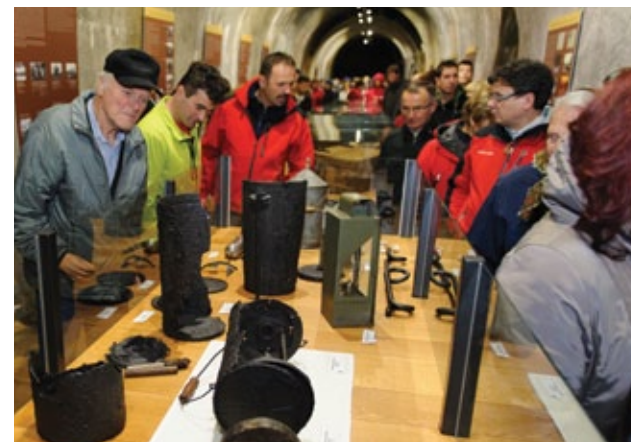
Stalna razstava v utrdbi

V utrdbi si lahko ogledate stalno razstavo ostalin iz časa gradnje, v prostranih dvoranah pa vse leto potekajo tudi različne prireditve, med katerimi je najbolj atraktivno baliranje z lesenimi krogami.