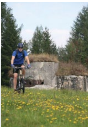
Aktivnosti v naravi

Poseben strateški pomen so imele utrde prav v naših krajih, saj je Poljanska dolina predstavljala lahek dostop do Ljubljane. Tri največje podzemne utrde, ki so tudi najbolj ohranjene v celotni liniji, so na Golem vrhu, Hrastovem griču in Hlavčih Njivah. V letih 1940-1941 je utrde na zahodni liniji gradilo 60.000 ljudi, vojakov in civilnega prebivalstva. Zaključek gradbenih del so načrtovali v letu 1947, vendar je začetek 2. svetovne vojne dela prekinil. Obrambna linija ni nikoli služila svojemu namenu.