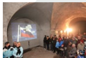
Prireditve v utrdbi