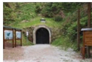
Vhod v utrdbo na Golem vrhu

Rapalska meja je bila spremenjena s Pariško mirovno pogodbo leta 1947, dokončno pa je bila meja z Italijo urejena šele leta 1975 z Osimskimi sporazumi.