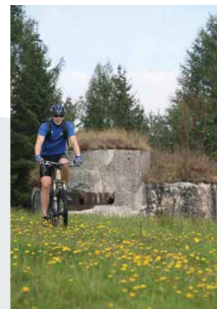
Aktivnosti v naravi

Poseben strateški pomen so imele utrdbe prav v naših krajih, saj je Poljanska dolina predstavljala lahek dostop do Ljubljane. Tri največje podzemne utrdbe, ki so tudi najbolj ohranjene v celotni liniji, so na Golem vrhu, Hrastovem griču in Hlavčih Njivah. V letih 1940-1941 je utrdbe na zahodni liniji gradilo 60.000 ljudi, vojakov in civilnega prebivalstva. Zaključek gradbenih del so načrtovali v letu 1947, vendar je začetek 2. svetovne vojne dela prekinil. Obrambna linija ni nikoli služila svojemu namenu.