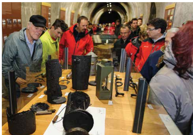
Stalna razstava v utrdbi