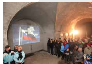
Prireditev v utrdbi