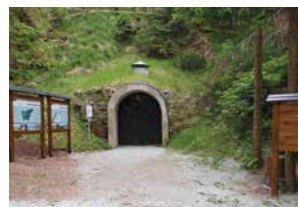
Vhod v utrdbo na Golem vrhu

Rapalska meja je bila spremenjena s Pariško mirovno pogodbo leta 1947, dokončno pa je bila meja z Italijo urejena šele leta 1975 z Osimskimi sporazumi.